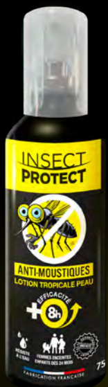
LOTION TROPICALE PEAU 75 mL - 8€59** ACL 3664951000426